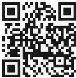
แบบมอบตัว ปริญญาตรี ๒๕๖๙

๑. ดาวน์โหลดเอกสารใบขึ้นทะเบียนนักศึกษา และแบบมอบตัว หน้าเว็บไซต์ ฝ่ายทะเบียนและวัดผลการศึกษา ได้ที่ https://sa.pit.ac.th/reg/?p=๕๒๖ หรือ แสกน QR Code