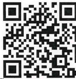
ใบขึ้นทะเบียนนักศึกษา ๒๕๖๙

๒. ชำระค่าขึ้นทะเบียนนักศึกษา จำนวน ๖,๐๐๐ บาท (หกพันบาทถ้วน) ทางบัญชีธนาคารกรุงไทย เลขที่บัญชี ๐๐๘-๐-๐๐๗๕๕-๔ หรือชำระผ่าน QR Code