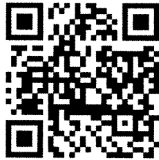
แบบมอบตัว ปริญญาตรี ๒๕๖๙

๑. ดาวน์โหลดเอกสารใบขึ้นทะเบียนนักศึกษา และแบบมอบตัว หน้าเว็บไซต์ ฝ่ายทะเบียนและวัดผลการศึกษา ได้ที่ https://sa.pit.ac.th/reg/?p=๕๒๖ หรือ แสกน QR Code